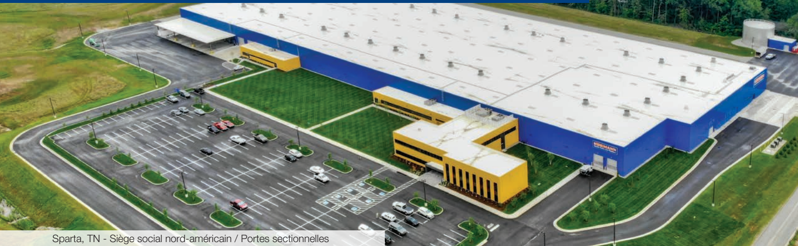
Sparta, TN - Siège social nord-américain / Portes sectionnelles