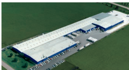
Montgomery, IL - Portes sectionnelles