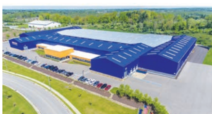
Burgettstown, PA - Portes haute performance

En tant qu'un des leaders mondiaux fabricants de portes que nous sommes engagé à offrir le meilleur qualité, valeur et sélection. Qu'il soit résidentiel, commercial ou industriel, nous avons la porte où vous êtes à la recherche de. Chaque produit Hörmann vous offre la gamme parfaite de des avantages et des options pour satisfaire vos clients.