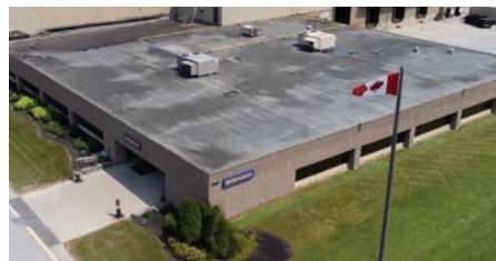
Barrie, ON Canada - Portes haute performance