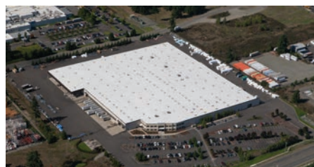
Puyallup, WA - Portes sectionnelles