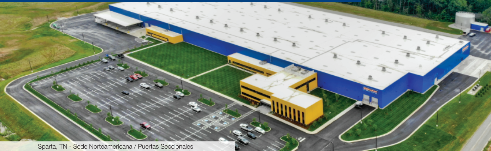
Sparta, TN - Sede Norteamericana / Puertas Seccionales