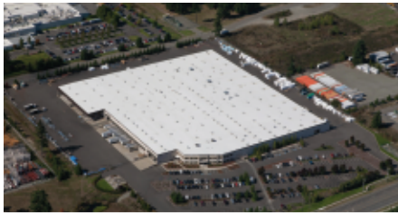
Puyallup, WA - Puertas Seccionales