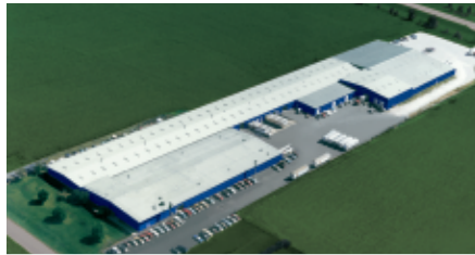
Montgomery, IL - Puertas Seccionales