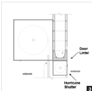
Contraventana para huracanes bajo el soporte del dintel

Porque cumplir con las especificaciones de clasificación de huracanes Para nuevas construcciones se pueden realizar proyectos de renovación desafiante, ofrecemos tres configuraciones de montaje para la contraventana contra huracanes en tándem en nuestra puerta doble solución: montaje exterior, debajo del dintel de la puerta o encima del dintel de la entrada. Es importante señalar que al montar la contraventana contra huracanes en tándem debajo el encabezado de la puerta, de 10 a 12 pulgadas de espacio libre es sacrificado. Dependiendo de la altura del tráfico moviéndose a través de la abertura, se puede obtener altura adicional es necesario agregarlo a la abertura de la puerta.