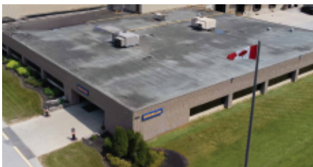
Barrie, ON Canada - Puertas de alto rendimiento