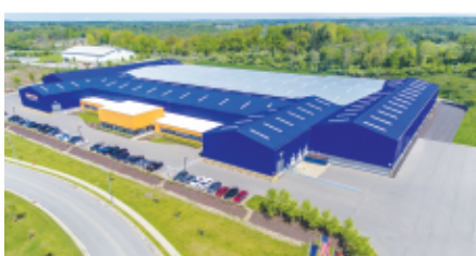
Burgettstown, PA - Puertas de alto rendimiento

Al ser uno de los fabricantes de puertas líderes en el mundo, estamos comprometidos a proporcionar la mejor calidad, valor y selección. Ya sea residencial, comercial o industrial, tenemos la puerta que usted esta buscando. Cada producto Hörmann le ofrece la variedad perfecta de beneficios y opciones para satisfacer su clientela.