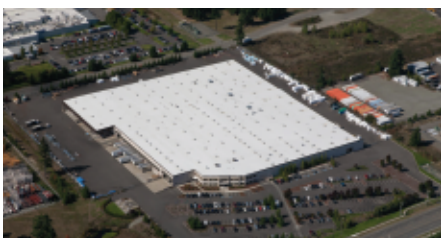
Puyallup, WA - Puertas Seccionales