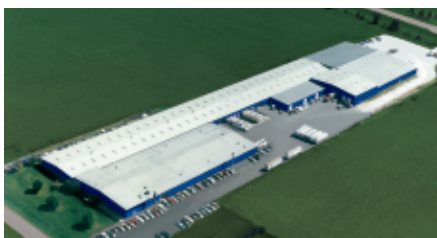
Montgomery, IL - Puertas Seccionales