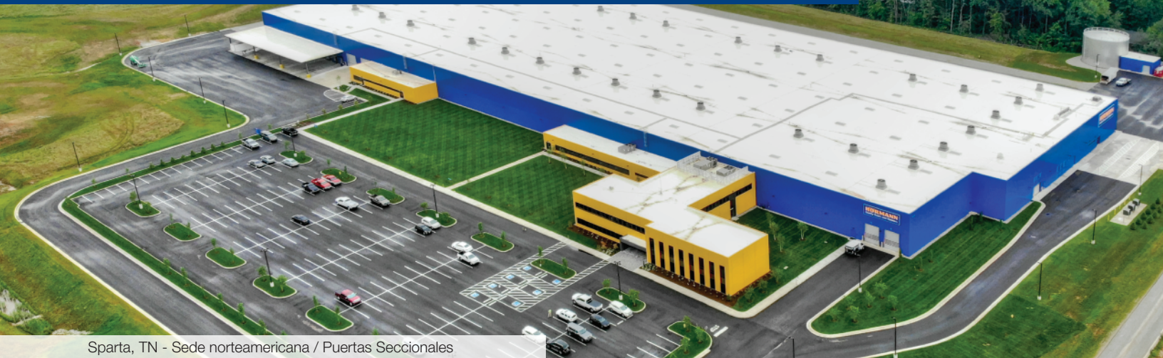
Sparta, TN - Sede norteamericana / Puertas Seccionales