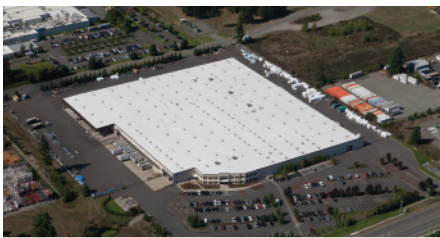
Puyallup, WA - Puertas Seccionales