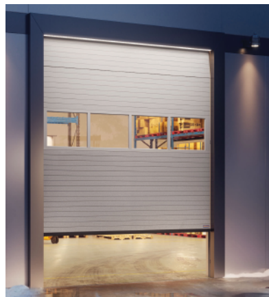
Ranura de micrófono plateada metálica con aluminio de vista completa sección