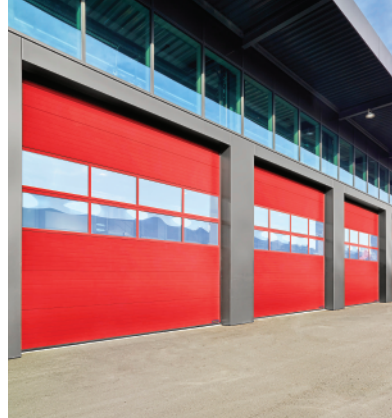
Microgroove pintado Galaxy con 2 vistas completas Secciones de Aluminio

Las secciones de vista completa (opción 3) también pueden ser pintadas para que hagan juego con la puerta.