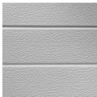
Los paneles 440U y 450U están producidos en un diseño de microsurcos con relieve similar al de estuco