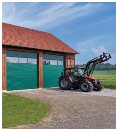
Microranura pintada Galaxy con aluminio de vista completa sección