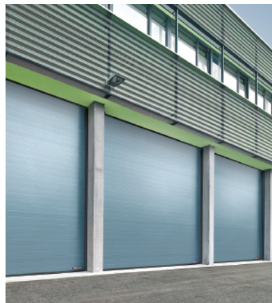
Microgroove pintado de galaxia sin ventanas