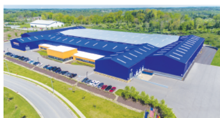
Burgettstown, PA - Puertas de alto rendimiento

Al ser uno de los fabricantes de puertas líderes en el mundo, estamos comprometidos a proporcionar la mejor calidad, valor y selección. Ya sea residencial, comercial o industrial, tenemos la puerta que usted esta buscando. Cada producto Hörmann le ofrece la variedad perfecta de beneficios y opciones para satisfacer su clientela.