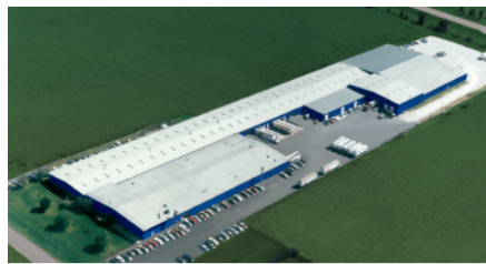
Montgomery, IL - Puertas Seccionales